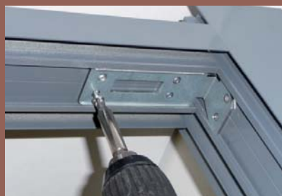
Montage par équerre