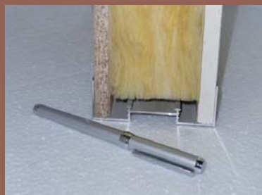
Acoustique renforcée (PAR 85)