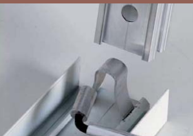
Montage par ressort excentrique