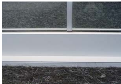
Parclose droite (H5-H7)