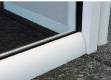
Parclose arrondie (H5-H7)